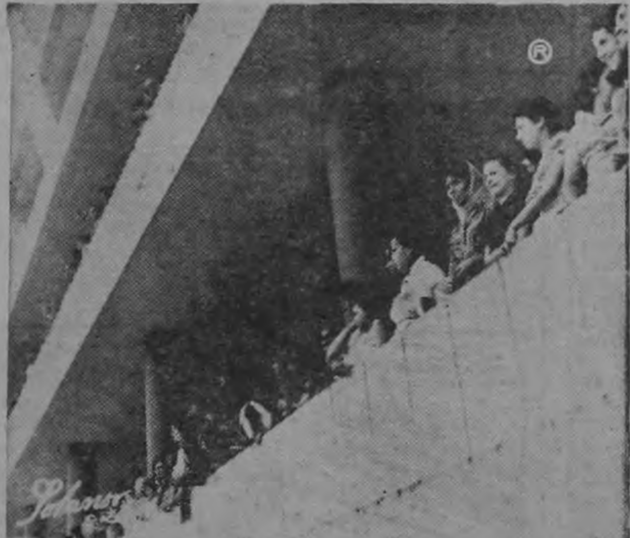
Una vista general del público que en proporción numerosa se dio cita en los balcones del aeropuerto de El Coco para dar la bienvenida al candidato del Partido Liberación.