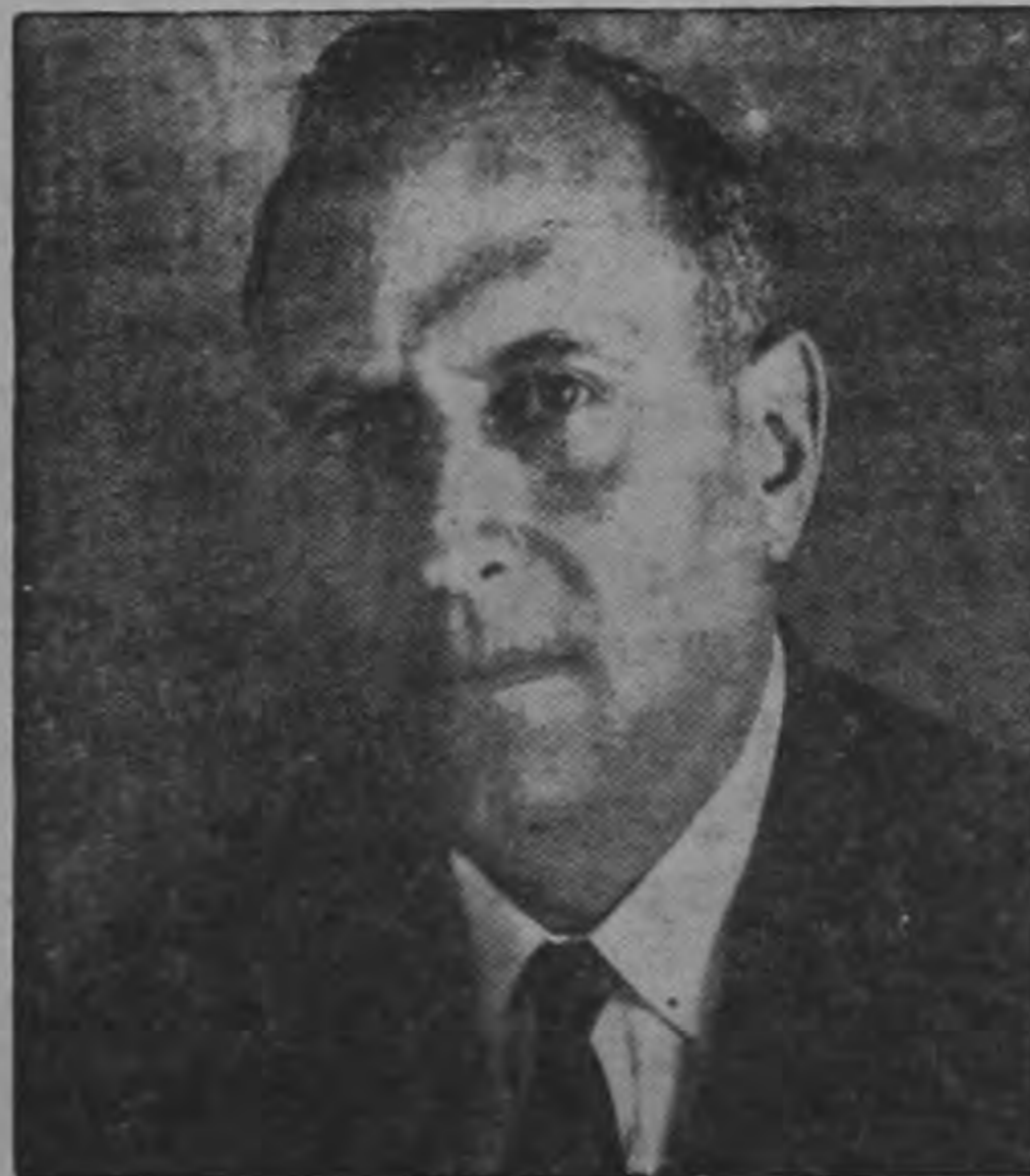
Dr. RAFAEL ANGEL CALDERON GUARDIA Jefe y Presidente del Partido Republicano

A partir de la promulgación de la nueva Constitución Política, esas funciones que antes se repartían entre el Poder Ejecutivo y el Legislativo, con relación a la materia electoral, pasaron a integrarse en un proceso ordenado, dirigido, organizado y supuesto a la vigilancia de un tribunal de nombramiento de la Corte Suprema de Justicia. Se cimentaba pues, un organismo con suficiente capacidad para encarar en forma imparcial, la conducción de los procesos electorales. De lo que aquí hemos dicho, se desprende que el Tribunal Supremo de Elecciones representa el nervio jurídico de todo el proceso electoral. Si se desconoce su autoridad, si se menoscaba la eficacia de sus resoluciones, habrá el país retrocedido un paso en la estructura constitucional existente.