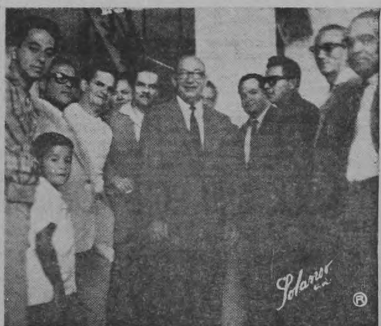
Don Francisco Orlich rodeado de partidarios, altos personeros del Partido Liberación y amigos personales, poco después de su llegada al aeropuerto.